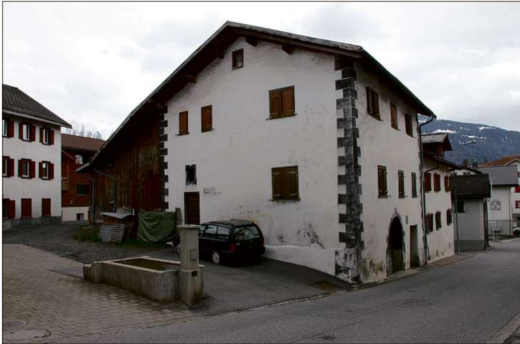
La casa paterna dil poet da Laax sper la via principala.