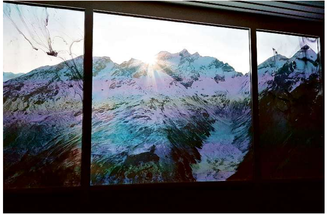
Sco ord ina finiastra contemplan ins il video cun scenas entuorn las poesias – inclusiv tolcas da tenta.