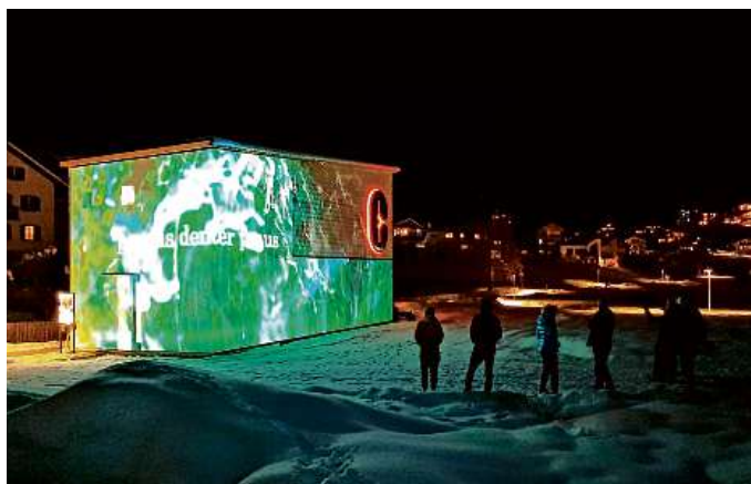
La Cularta ei zugliada en in manti da colurs.