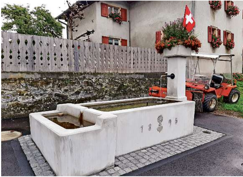
La fontauna sil Crest a Laax ei renovada e gl'orsal 1895 cuagl ornament tarlischa puspei.