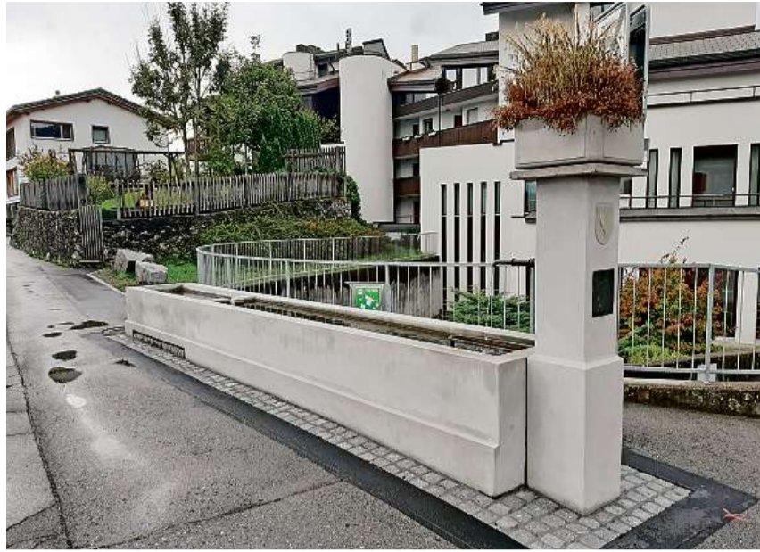
Alla fontauna a Fuornatsch maunca mo aunc il niev spitg silla petga.