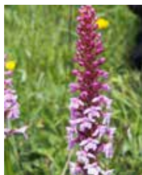
Mücken-Handwurz orchidea muschin temps da flurizium: 15-06 tochen 01-08