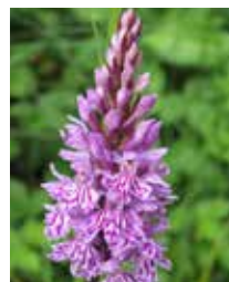
Fuchsfingerwurz orchidea maclada temps da flurizium: 15-05 tochen 15-08