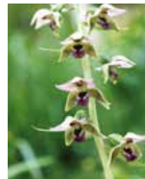
Breitblättrige Stendelwurz orchidea clara Blütezeit: 15.07. bis 15.08.

Agnes Foppa, amatura d'orchideas, marchescha ils loghens cun las specias en flurizium. Silsuenter vegnan las marcaziuns puspei allontanadas.