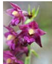
Rotbrauner Stendelwurz orchidea brina temps da flurizium: 15-06 tochen 15-08