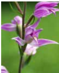
Rotes Waldvögelein cefalantera cotschna Blütezeit: 01.06. bis 01.08.