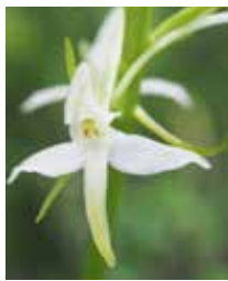
Zweiblättrige Wadhyazinthe giacinta d'ual Blütezeit: 30.05. bis 15.08.