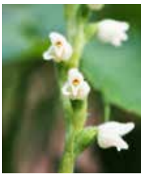
Moosorchis orchidea da mescl temps da flurizium: 15-07 tochen 15-08