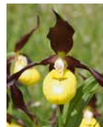
Frauenschuh pantofla da Nossadunna Blütezeit: 30.05. bis 15.06.