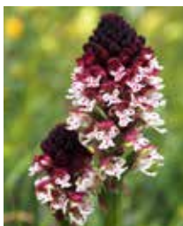
Angebranntes Knabenkraut orchidea stgira Blütezeit: 05.05. bis 15.06. 01.07. bis 31.08.