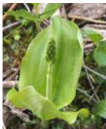
Grosses Zweiblatt listera ovata temps da flurizium: 01-05 tochen 15-07