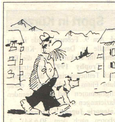
Schon wieder diese teure Hundesteuer!