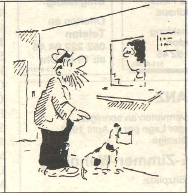
Dann haben Sie ihn noch nie beim Fressen gesehen, Fräulein. Er ist eine Katastrophe!