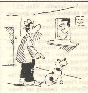
Aber als Katastrophenhund muss er keine Steuer zahlen, oder?