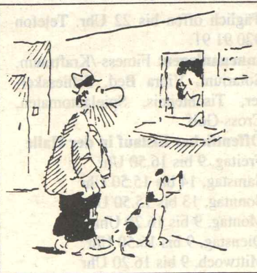
Mir sieht er aber gar nicht wie ein Katastrophenhund aus.