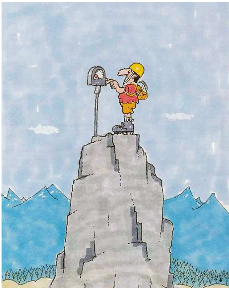
Talas caricaturas han dau character al Nebelspalter. Tier quella dretg enconusch'ins il vitg da Laax.

Dumengia proxima, ils 12 da fever 2023, presenta la Fundaziun Pro Laax il cudisch «Was soll es denn da noch zu lachen geben?! – Hans Moser 1922–2012». L'occurrenza cun referat ei allas 17.00 ell'aula dalla casa da scola a Laax.